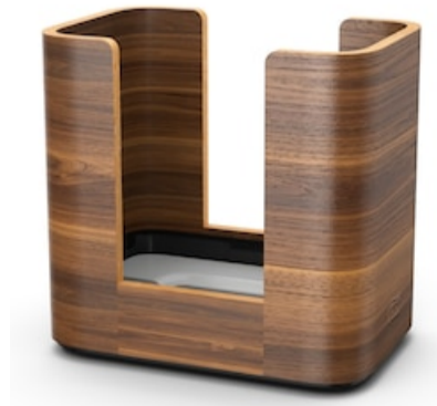
Tork XPN NapDisp, Walnut (N4) 273002