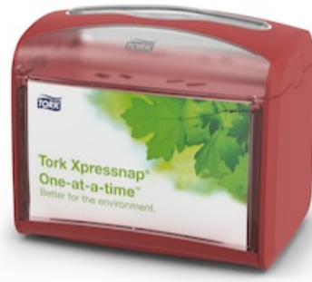
Tork XPN Tabletop NapDisp, Red (N4) 272612