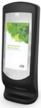
Tork XPN Stand NapDisp, Black (N4) 272211