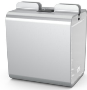
Tork XPN NapDisp, Aluminium (N4) 274002